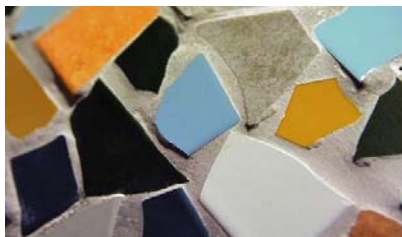
Skärvor av kakelplattor bildar ett mosaikmönster som täcker hela bilen.