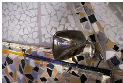
Backspegeln har lämnats blank och baklyktan är klädd med kopparmynt, resten av bilen täcks av små kakelskärvor.